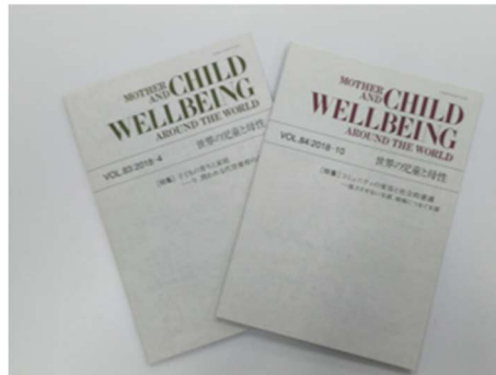
情報誌「世界の児童と母性」

当初計画にありませんでしたが、将来的なデジタル化の加速を考慮し、より多くの方々に届けられるよう、創刊号から直近発行の号の全てをバックナンバーとしてホームページで閲覧できるようにしました。