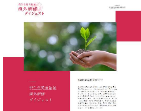
海外研修ダイジェスト HP 画面

過去研修のまとめとして、新コンテンツ「海外研修ダイジェスト」を財団 HP に追加しました。同時に、当研修の知見をより多くの方々に共有するため、財団 HP の海外研修事業ページにも全報告書の PDF を掲載しました。